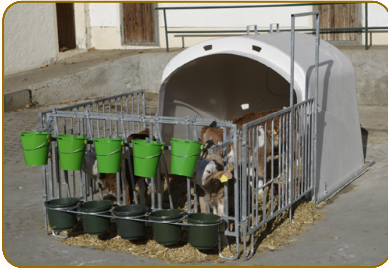
Renforcement métallique à la base de la niche